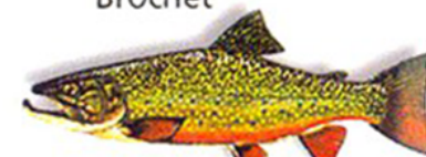
saumon de Fontaine