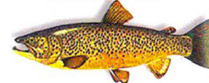
Truite de Rivière (fario)